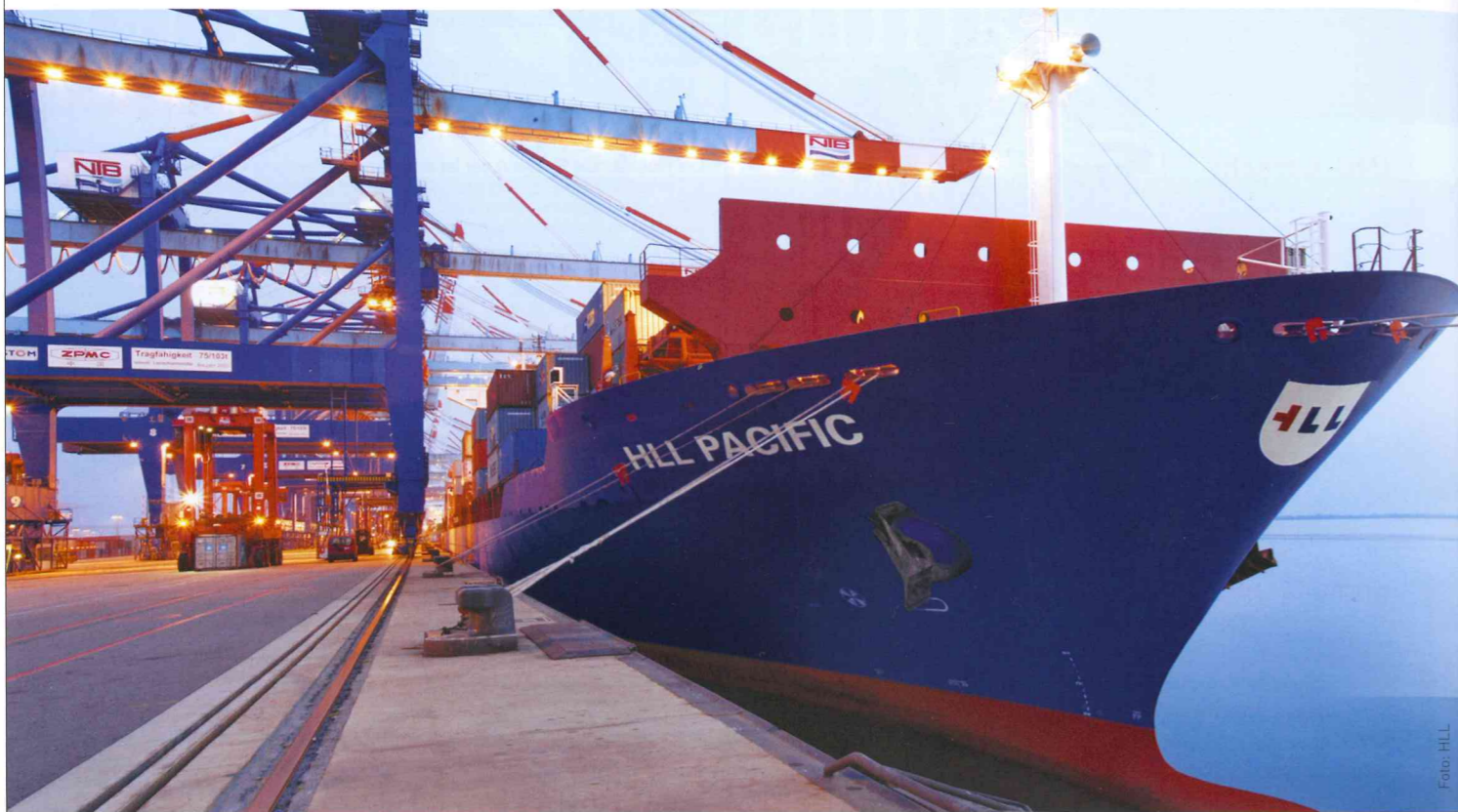
CONTAINERFLOTTE: Ein effizienter Schiffsbetrieb schont die Umwelt.